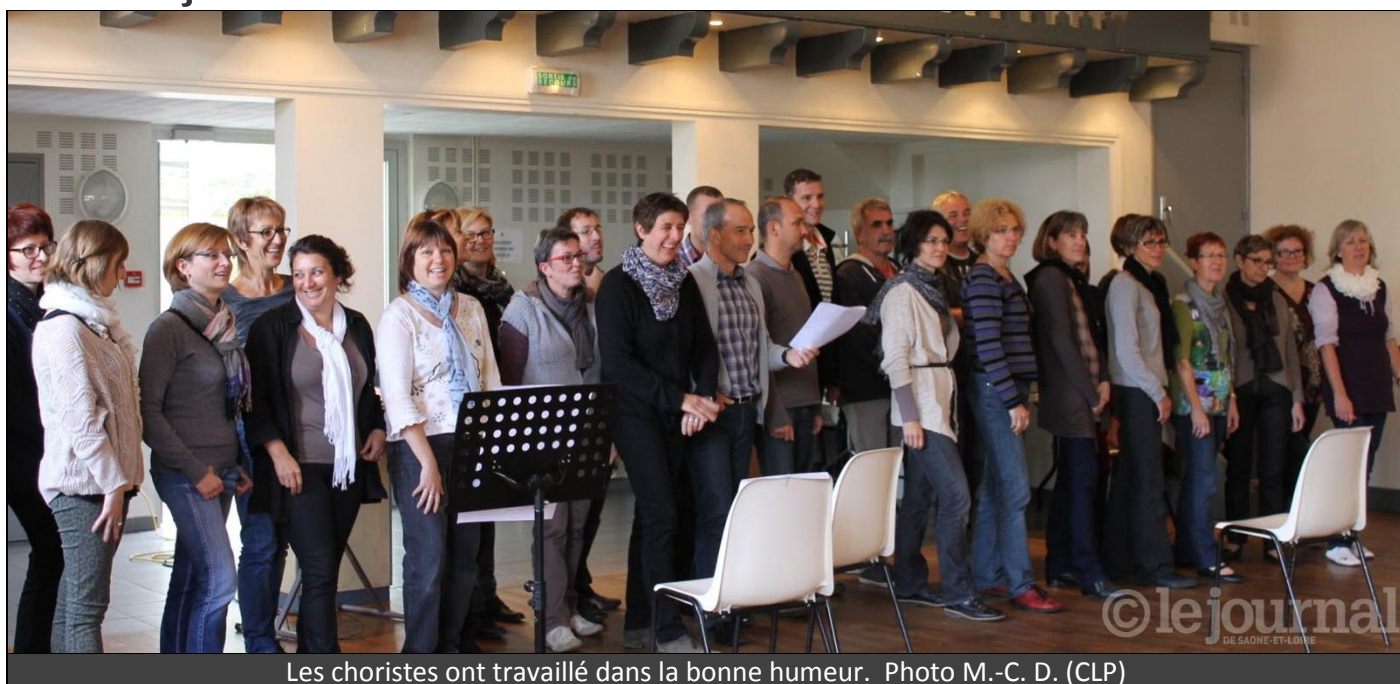
Les choristes ont travaillé dans la bonne humeur.

Une chanteuse professionnelle est intervenue auprès des choristes de Demigny fa sol pour leur permettre de progresser.