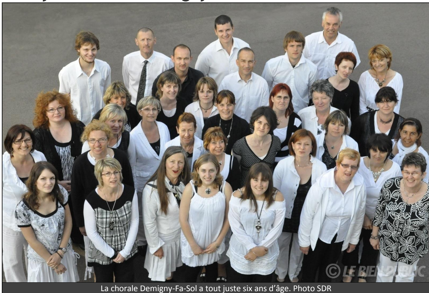
La chorale Demigny-Fa-Sol a tout juste six ans d'âge.

Dimanche prochain, à l'invitation du Comité des fêtes d'Auxey-Duresses, la chorale Demigny-Fa-Sol donnera un concert en l'église du -village.